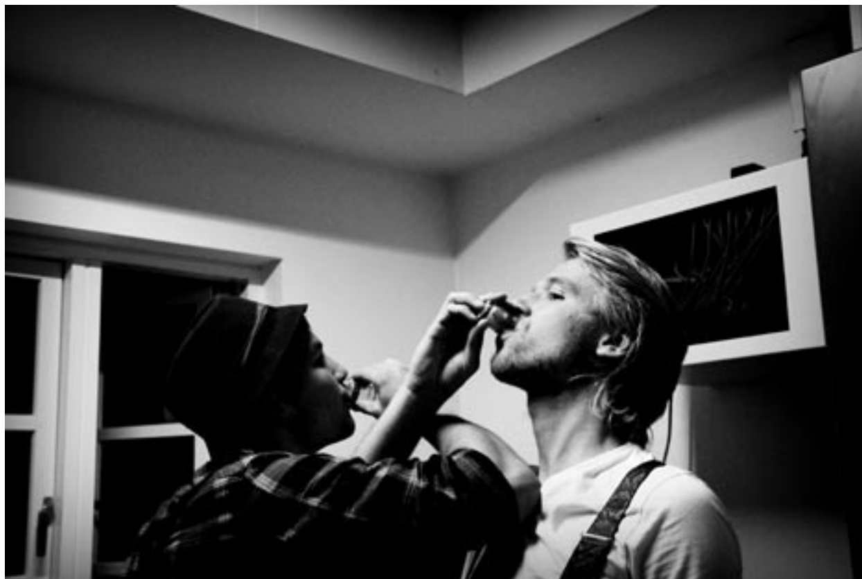
»2010 set i billeder«