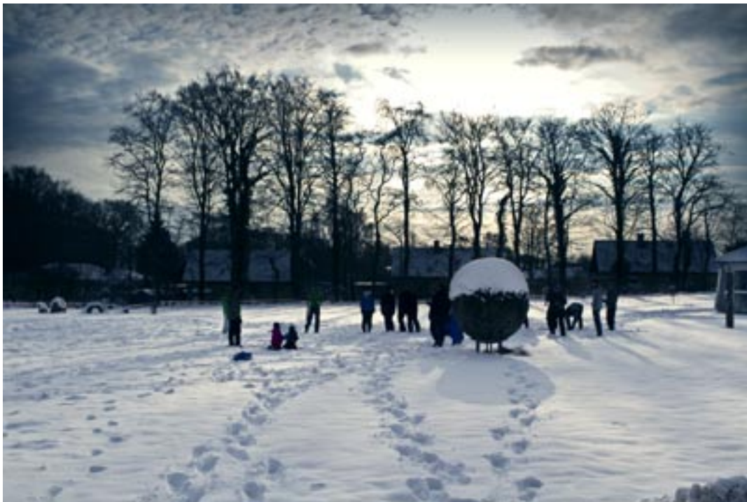
»2010 set i billeder«