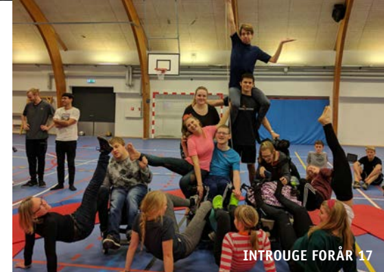
INTROUGE FORÅR 17