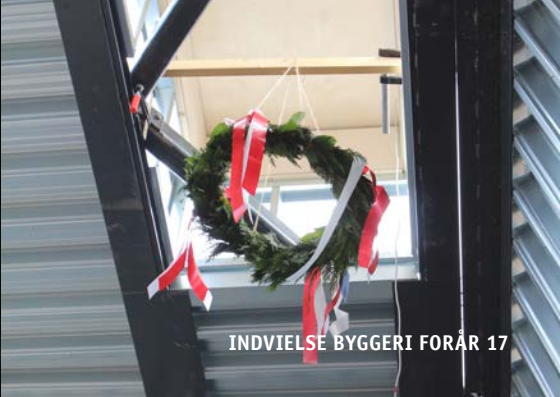
INDVIELSE BYGGERI FORÅR 17