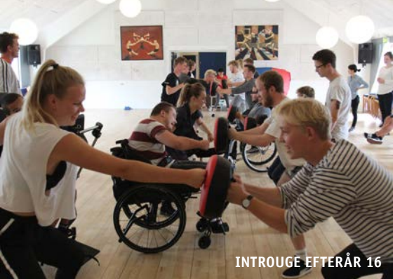
INTROUGE EFTERÅR 16