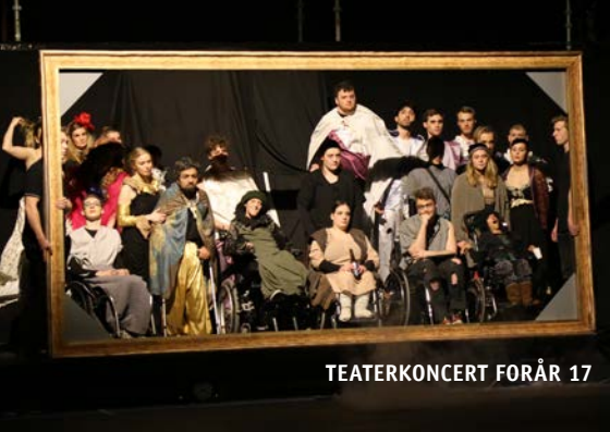
TEATERKONCERT FORÅR 17