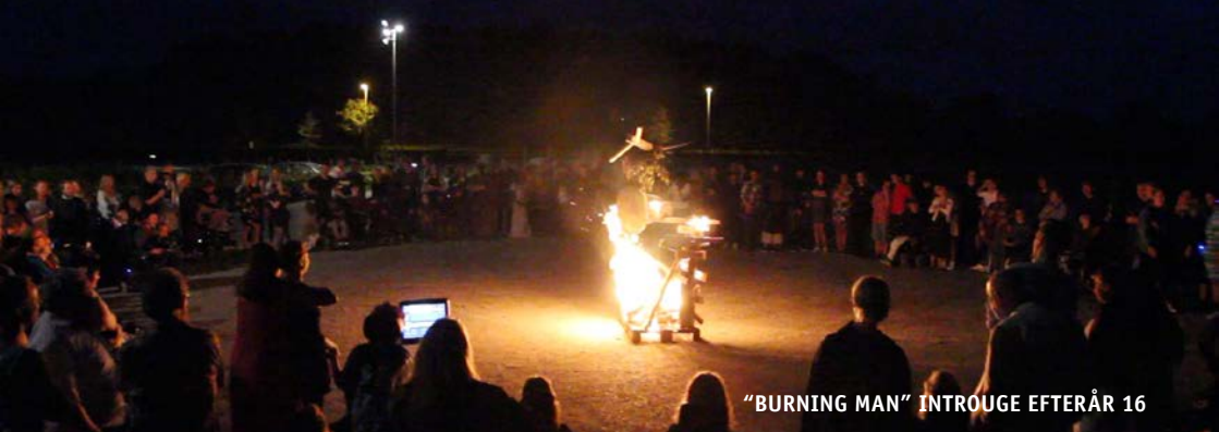
"BURNING MAN" INTROUGE EFTERÅR 16