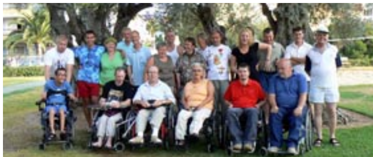
Mallorca- turen 2007

I Elevforeningen glæder det os meget, at der fortsat er stor interesse for at modtage nyhedsbrev på E-mail fra Elevforeningen om, hvad der sker på Egmont og i Elevforeningen. Vi bestræber os på at sende et nyhedsbrev ud minimum hvert kvartal, men ellers efter behov. Hvis du ikke allerede er med på E-mail-listen, kan du tilmelde dig ved at sende en mail til Jens Bork på E-mail adressen: »jcbork@stofanet.dk«. Du kan også sende din E-mail-adresse via Elevforeningens hjemmeside.