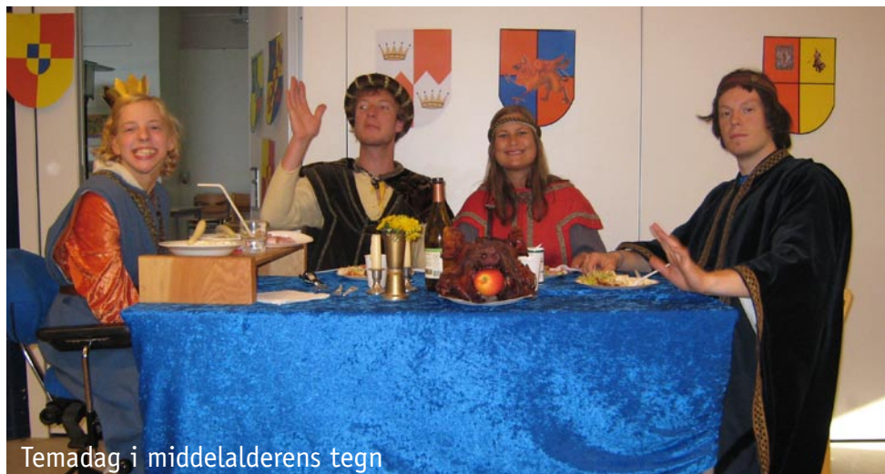
Temadag i middelalderens tegn

Efter en halv times læsning faldt jeg i søvn efter en udmærket dag.