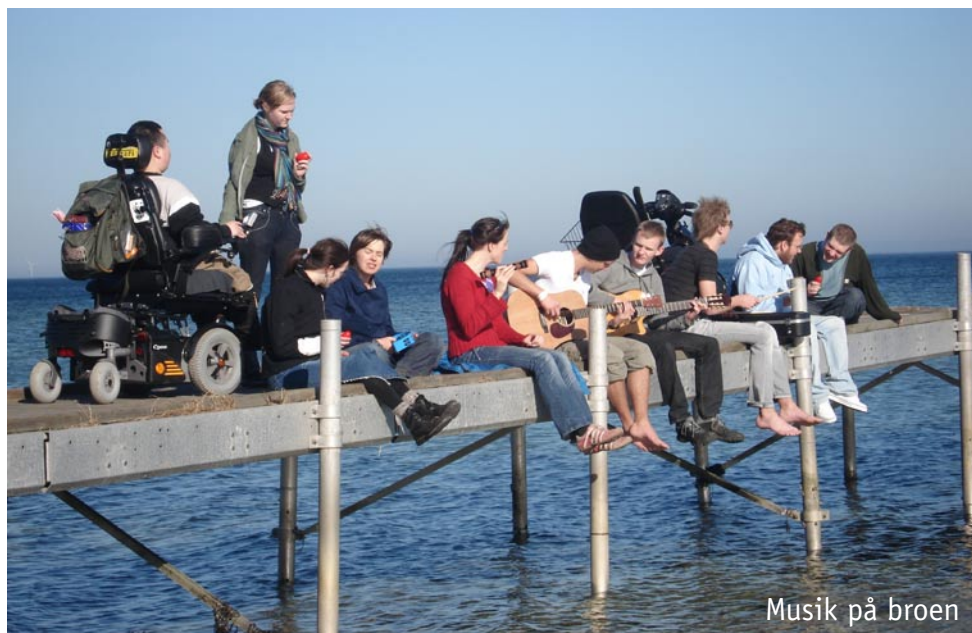
Musik på broen

præcis hvad jeg vil have og er taknemmelig for at jeg vil have det hos ham. Jeg går altid smilende fra hans butik, opløftet af udsynet til frisk nikotin. Jeg ryger Dunhill og intet andet. – Vi ryger lidt i tavshed. Der kommer et råb ovenfra et sted. Hans ansigtstræk viser et kort sekund bedrøvelse, så kigger han på mig; "Du kan gå op nu...".