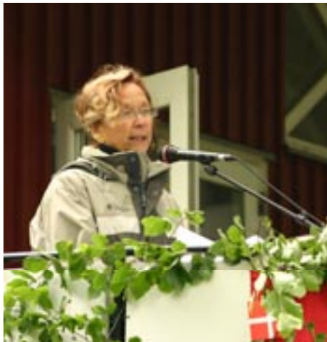
fhv. sundhedsminister Ester Larsen (MF)