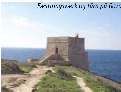
Fæstningsværk og tårn på Gozo

nordvest for Malta. Sammenlignet med Malta er Gozo mere landlig og fredelig. Geologien er mere varieret og kontrasterne større med typiske fladtoppede høje og færre bebyggede områder. På Gozo er der også forskellige fæstningsværker og barrikader fra tempelriddertiden. Man kan komme til Gozo på to måder; med færgen fra Malta, det tager ca. 25 minutter. Men man kan også bruge helikopter fra Maltas internationale lufthavn til Gozos lufthavn. Det tager ca. 10–15 minutter.