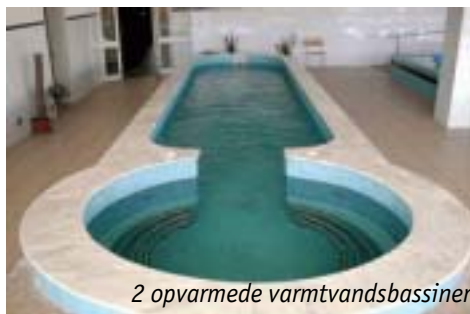
2 opvarmede varmtvandsbassiner

Korttidsophold er på ca. 1 uge. Disse ophold kan finde sted med kortere eller længere mellemrum, afhængigt af familiens behov og situation.