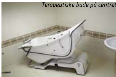
Terapeutiske bade på centret

Ophold for udlændinge og grupper er bed and breakfast tilbud til mennesker med handicap fra andre lande.