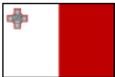
Malta National Flag